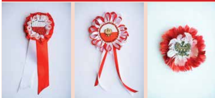
I miejsce – Elena Guzowska, Oddział Przedszkolny przy Szkole Podstawowej nr 3 w Łapach