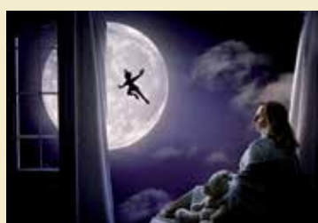
Fot. zainspirowana książką „Piotruś Pan” J.M. Barriego