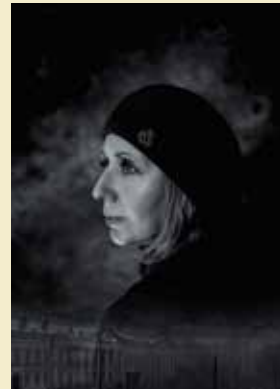
Fot. zainspirowana książką „Szmaragdowa Tablica” Caril Montero