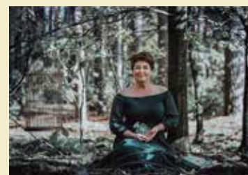
Fot. zainspirowana książką „Złota klatka” Camilli Lackberg