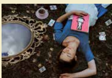
Fot. zainspirowana książką „Alicja w Krainie Czarów” Lewisa Carrolla