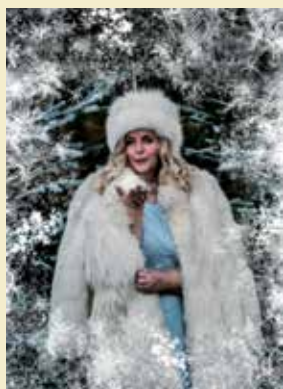
Fot. zainspirowana książką „Królowa Śniegu” Hansa Christiana Andersena