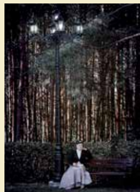
Fot. zainspirowana książką „Anna Karenina” Lwa Tolstoja