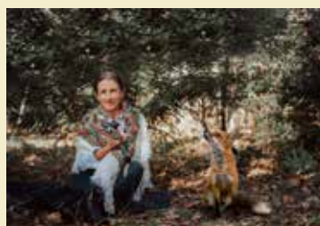
Fot. zainspirowana książką „Saga Puszczy Białowieskiej” Simony Kossak