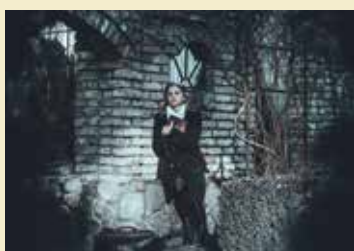
Fot. zainspirowana książką „Złodziejka książek” Markusa Zusaka