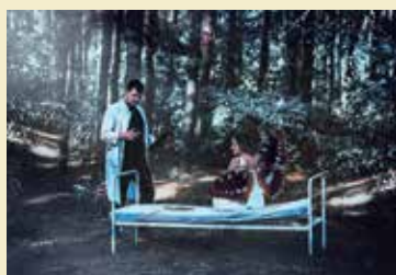
Fot. zainspirowana książką „Motyl” Lisy Genovy