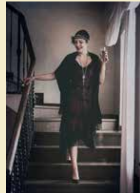
Fot. zainspirowana książką „Wielki Gatsby” F. Scotta Fitzgeralda