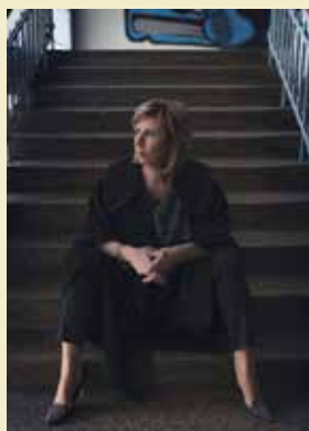
Fot. zainspirowana książką „Chyłka. Zaginięcie” Remigiusza Mroza