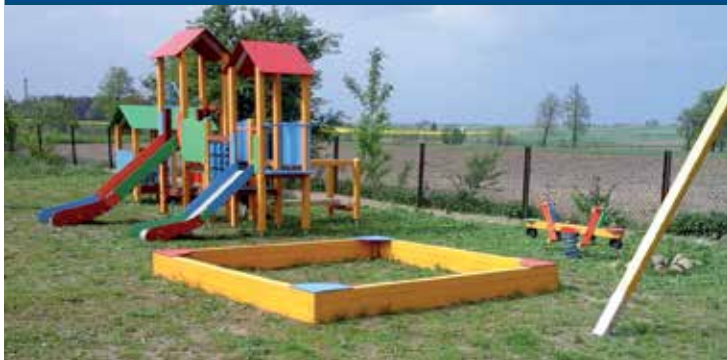
Plac zabaw w Łapach Pluśniakach